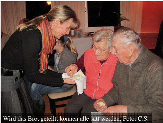
Wird das Brot geteilt, können alle satt werden.