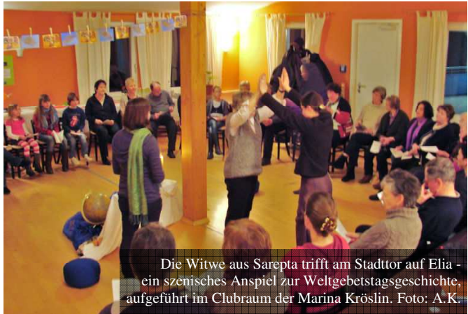
Die Witwe aus Sarepta trifft am Stadttor auf Elia - ein szenisches Anspiel zur Weltgebetstagsgeschichte, aufgeführt im Clubraum der Marina Kröslin.

Durch einen Diavortrag und Erfahrungsberichte lernten wir Land und Leute kennen und stellten