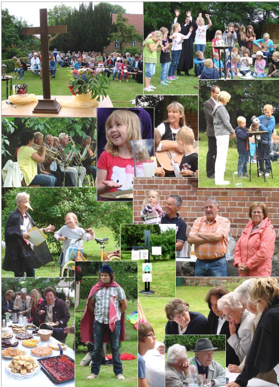
Impressionen vom Gemeindefest 2011